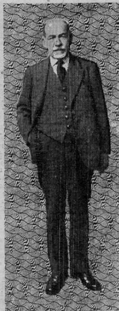
Señor Presidente de la República Lic. don Cleto González Viquez, en cuyo gobierno se rea-