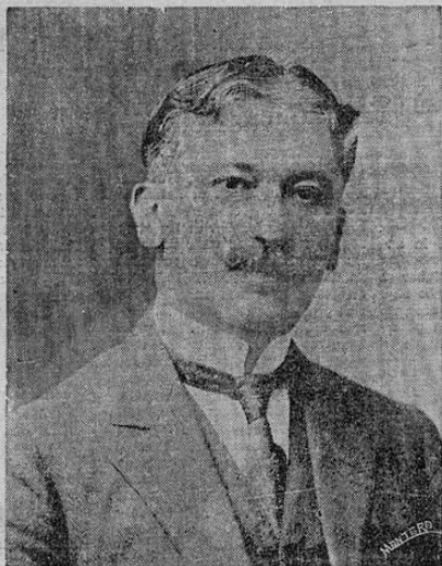
Ex-presidente don Julio Acosta presidente del comité de pavimentación que ha ejecutado la hermosa y meritoria obra.

dades de Alajuela, Heredia y esta capital. Aprovechamos esta oportunidad para ofrecer a nuestros lectores dos aspectos de un trecho de esa carretera, en fotografías tomadas en la sección del Virilla en donde se termina ya ese trabajo y que muestra lo que aquello era y lo que ahora será.